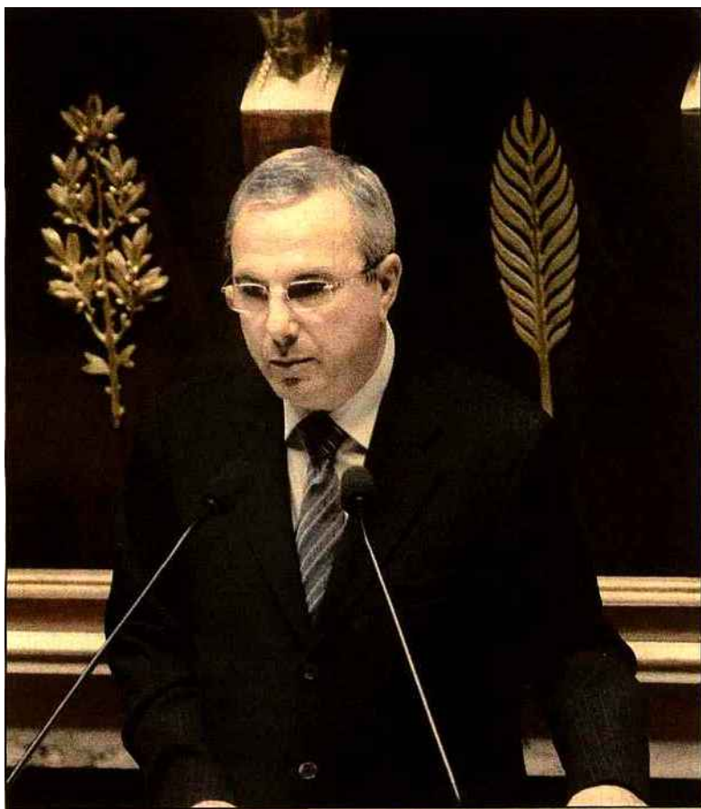
Jean Léonetti : “Le tiers n’est pas transparent, il est légitime qu’il ait une part de responsabilité parentale plus que d’autorité parentale.”

intéressant de noter que le travail du député est placé sous l’autorité du ministre de la Justice Rachida Dati, alors que jusqu’à présent, la secrétaire d’Etat à la famille Nadine Morano était leader sur le sujet. Serait-ce le début d’un désaveu ?